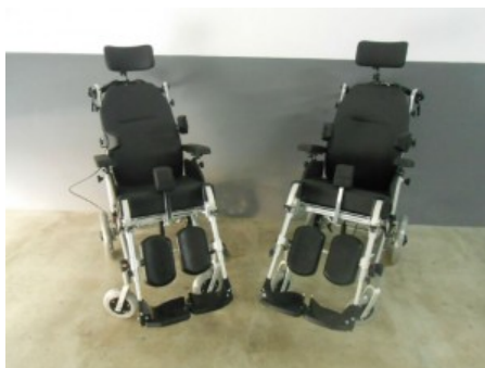
As duas cadeiras de rodas adaptadas que serão hoje entregues na frente-mar da vila.

Tendo completado cinco anos de existência a 30 de Maio último, a ADBRAVA tem-se destacado a vários níveis no apoio à população ribeira-bravense.