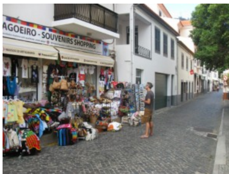
Novo projecto aposta na integração social e valorização pessoal dos desempregados.

A ADBRAVA irá iniciar um novo projecto denominado “Reinserção das Pessoas na Sociedade e no Trabalho” no âmbito do estágio curricular de um aluno do Curso Tecnológico de Acção Social da Escola Básica e Secundária Padre Manuel Alvares. Este projecto inclui diversos workshops destinados a pessoas desempregadas e visa “promover a integração social e a valorização pessoal”.